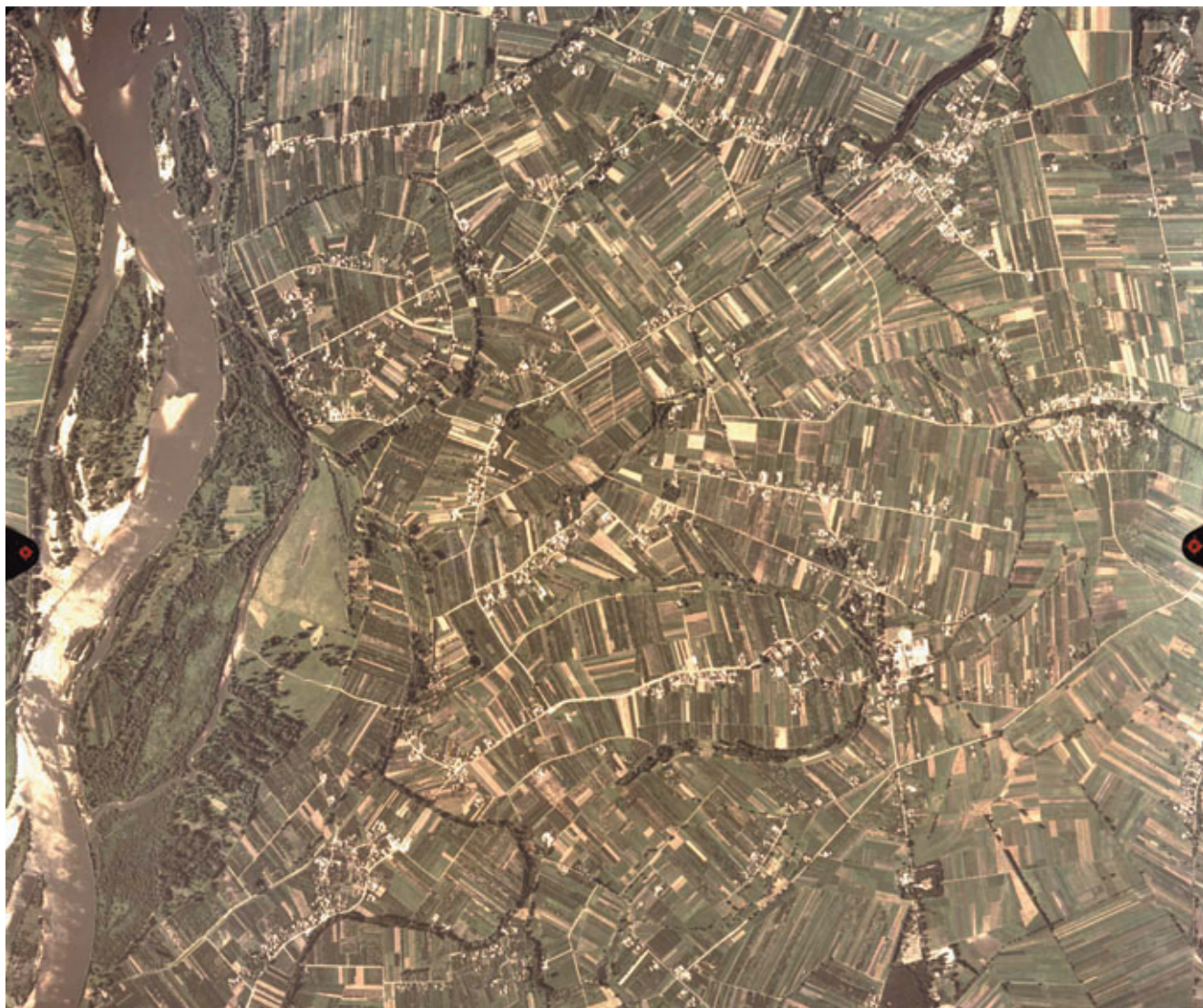
Ryc. 44. Przelomowa Dolina Wisły (8.1.1) i Kotlina Chodelska (8.1.3). Okolice miejscowości Majdany, na NW od Opola Lubelskiego.

Fig. 44. The Vistula River gorge Valley (8.1.1) and Kotlina Chodelska [the Chodelska Dale] (8.1.3). Vicinity of the village of Majdany, to the NW of Opole Lubelskie.