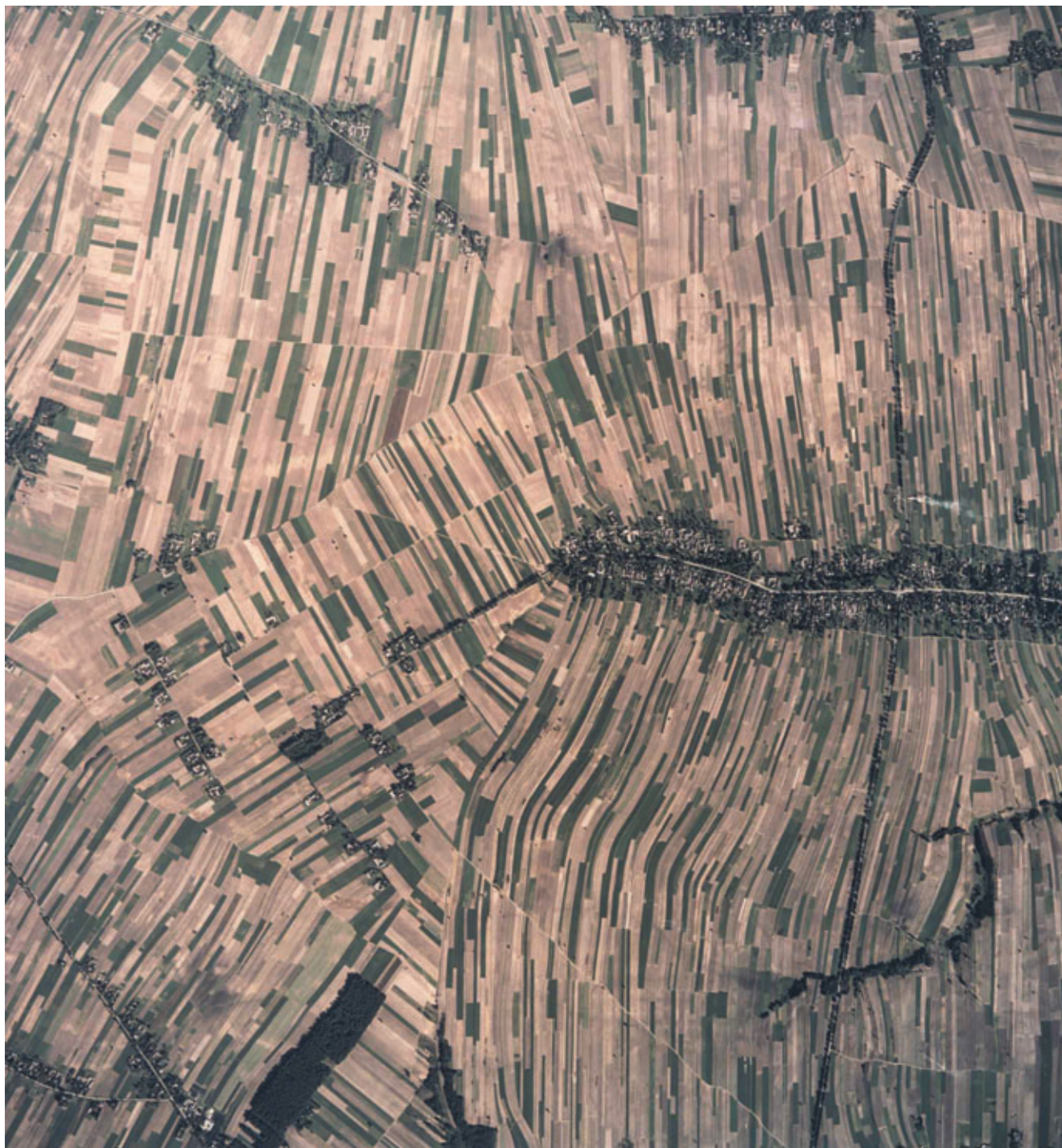
Ryc. 46. Wyżyna Lubelska (8.1.5). Krajobraz wyżyny lessowej w okolicach Bychawy i Kietczowa.

Figure 46. Wyżyna Lubelska [the Lubelska Upland] (8.1.5). Landscape of loessal upland in the vicinity of Bychawa and Kietczów.