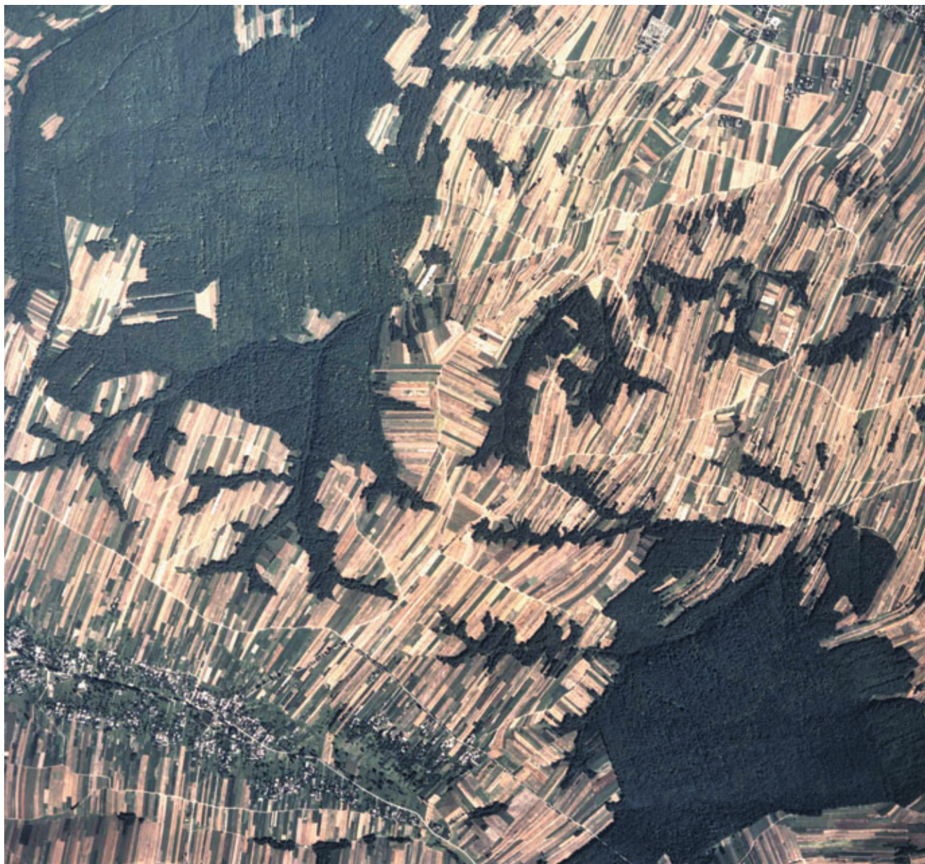
Ryc. 45. Wyżyna Lubelska (8.1.5). Krajobraz wyżyny lessowej w okolicach Gródek i Huty Turobińskiej na północ od Frampola.

Figure 45. Wyżyna Lubelska [the Lublin Upland] (8.1.5). Landscape of loessal upland in the vicinity of the village of Gródek and of Turobińska Steel Mill to the north of Frampol.