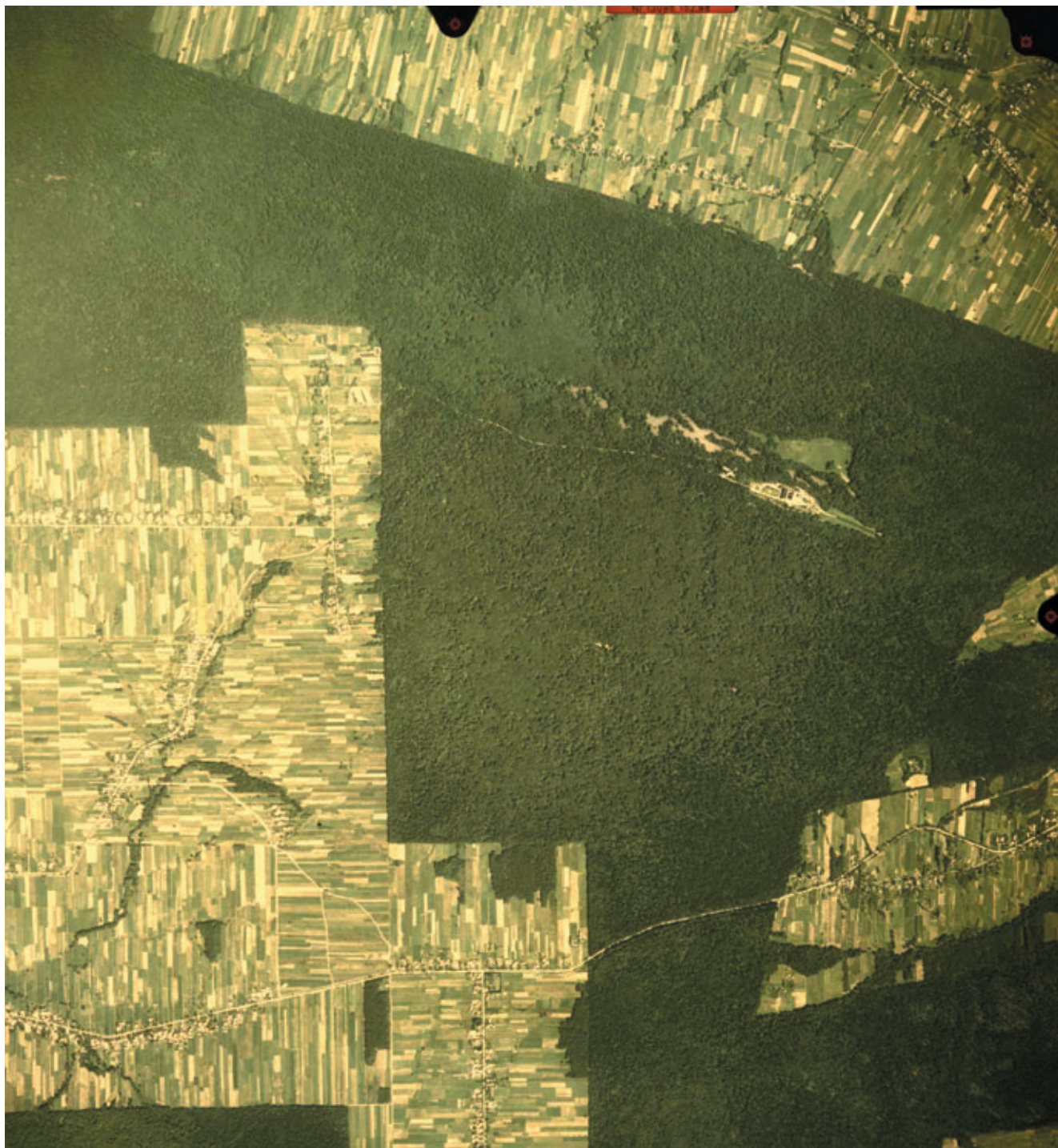
Ryc. 48. Góry Świętokrzyskie (9.1.10). Pasma Łysogórskie z przylegającym od północy Obniżeniem Bodzentyńsko-Słupiańskim (9.2.1) i od południa – Obniżeniem Kielecko-Łagowskim (9.1.11).

Figure 48. Góry Świętokrzyskie [the Świętokrzyskie Mountains (9.1.10)]. Łysogórskie Range with the adjacent Bodzentyńsko-Słupiańskie depression from the north (9.2.1) and Kielecko-Łagowskie lowering from the south (9.1.11).