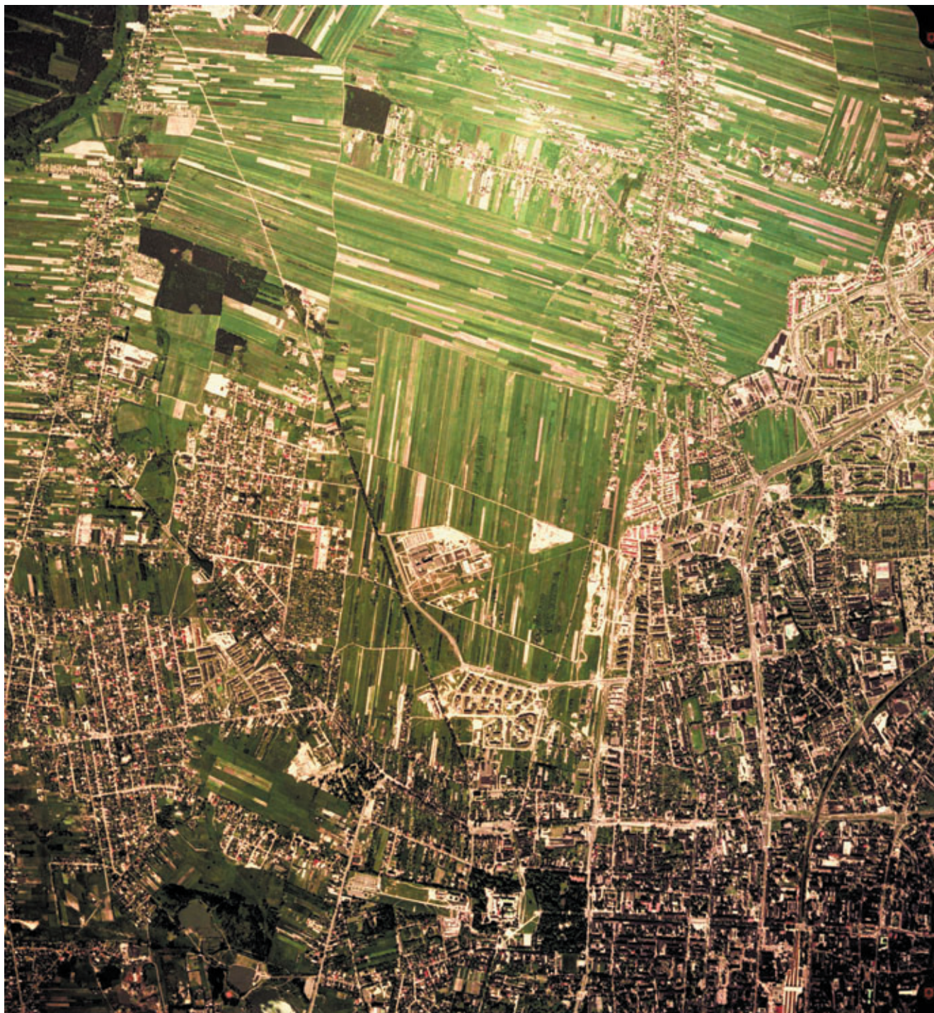
Ryc. 49. Wyżyna Częstochowska (9.4.1). Częstochowa.